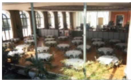
Salle Henri Faisans